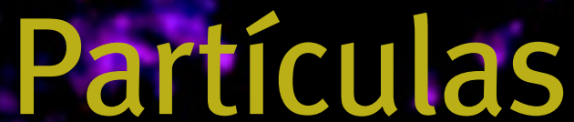
Imagem feita pelo Telescópio Espacial Hubble da galáxia Circinus, no centro da qual deve existir um buraco negro

Pós-doutorando do Centro de Gravitação e Cosmologia, Universidade de Wisconsin (Milwaukee, Estados Unidos)