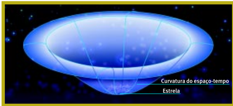
Figura 1. O espaço-tempo (a unificação das três dimensões espaciais e da temporal) é curvado na presença de energia (como a matéria e a radiação). Quanto maior a massa de uma estrela, por exemplo, maior será essa curvatura. Com a teoria da relatividade geral, idealizada em 1915, a força da gravidade – entendida até então como uma ação a distância entre dois corpos – passou a ser vista como uma consequência direta dessa curvatura

Mas a aceitação da existência desses objetos não foi nada imediata. Mais de duas décadas depois, em 1939, ainda encontramos o próprio idealizador da relatividade, Einstein, escrevendo nas conclusões de um trabalho: “As singularidades de Schwarzschild [isto é, buracos negros] não existem na realidade física.” Isso não foi, contudo, o que o físico norte-americano Robert Oppenheimer (1904-1967) e seu estudante norte-americano Hartland Snyder (1913-1962) concluíram naquele mesmo ano, ao investigarem o destino de estrelas suficientemente grandes.