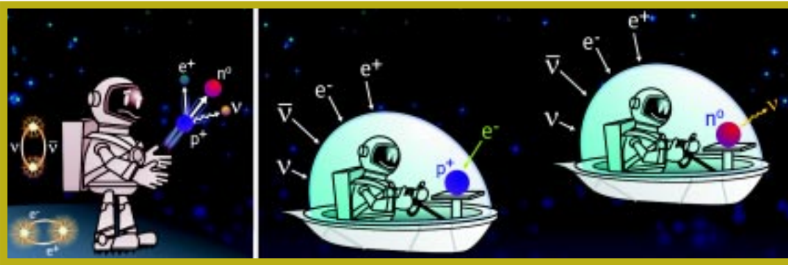
Figura 4. Em (a), um cientista parado em relação a seu laboratório observa que um próton ( p^+ ) acelerado no vácuo se converte em nêutron ( n^0 ) pela emissão de um pósitron ( e^+ ) e um neutrino ( \nu ). Em (b), o piloto, que leva um próton sobre uma pequena bandeja à sua frente, observa essa partícula se transformar em nêutron pela absorção de um elétron ( e^- ) e/ou antineutrino ( \bar{\nu} ) que estão presentes no vácuo. Por estar acelerado, o piloto da nave consegue observar essas partículas como reais, enquanto para o cientista elas são apenas virtuais

os prótons, nessas condições, são estáveis. Pelo menos, é isso o que a teoria-padrão das partículas elementares e os dados experimentais nos ensinam. Mas o que a teoria nos diz para prótons acelerados, isto é, sujeitos a forças? A resposta é que, nesse caso, os prótons passam a ser instáveis e podem se desintegrar em outras partículas, como mostrado abaixo: